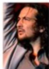
ANTONIO EL TABANCO, JAÉN